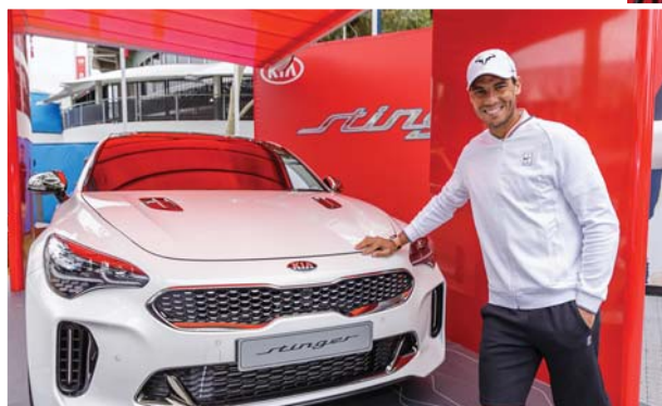
Rafael Nadal obok nowej Kia Stinger

Jednym z gości ceremonii przekazania 50 szt. modelu Carnival, 40 szt. Sorento i 20 szt. Optimy był ambasadora marki i wielokrotny zwycięzca turniejów wielkoszlemowych - Rafael Nadala, który wręczył dyrekcji Tennis Australia „symboliczny klucz flotowy”.