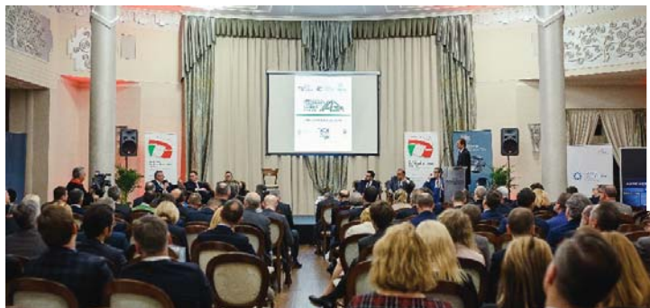
W tekście wykorzystano materiały prasowe i zdjęcia organizatora

W DNIACH 28–29 LISTOPADA 2017 W KATOWICACH ODBYŁO SIĘ KLUCZOWE SPOTKANIE BRANZY MOTORYZACYJNEJ: INTERNATIONAL AUTOMOTIVE BUSINESS MEETING 2017. UCZESTNICY WYDARZENIA DEBATOWALI M.IN. NAD TYM, JAKIE DZIAŁANIA NALEŻY PODJĄĆ, ABY W WYŚCIGU O POZYCJĘ LIDERA ELEKTROMOBILNOŚCI ZWYCIĘŻYĆ Z CHINAMI I USA.